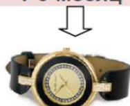
наручные часы «Золотое Время»