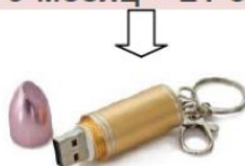
оригинальный флэш-накопитель «Помада» (4 Гб)