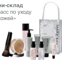
Мини-склад «Класс по уходу за кожей»

Принимая участие в программе, вы научитесь проводить классы по красоте разной тематики, получите доход и свой первый сюрприз от «Мэри Кэй».