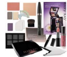
Мини-склад «Класс по декоративной косметике»