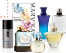
Мини-склад «Класс по ароматам»